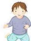
SE METTRE À GENOUX