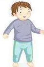
SE TENIR DEBOUT

RIEN NE SERT DE BRÛLER LES ÉTAPES : C'EST EN LAISSANT L'ENFANT LES FRANCHIR L'UNE APRÈS L'AUTRE, À SON RYTHME, QU'IL PROGRESSERA.