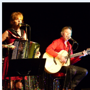
Une belle ambiance à la fête des aînés