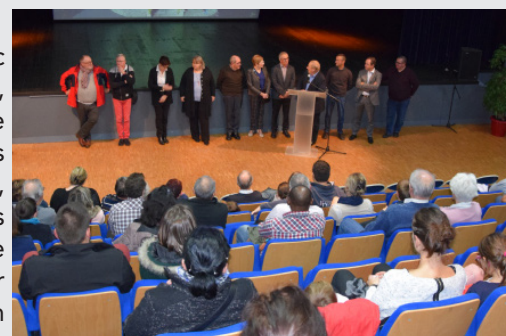
Le Maire a présenté l'équipe municipale aux nouveaux habitants

commerces, artisans et services, d'évoquer la vie associative si intense et de parler des réalisations et projets municipaux. Le nouveau film de présentation de la Commune a ensuite été projeté, puis le Maire s'est prêté au jeu des questions-réponses. Le verre de l'amitié clôturait ce premier contact avec les élus et chacun est reparti avec le nouveau guide d'accueil publié par la Commune et à destination des nouveaux habitants, ... plus de 350 nouveaux habitants ayant rejoint La Crèche entre 2016 et 2018.