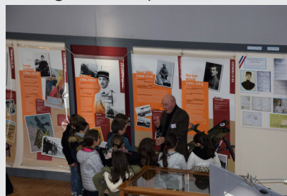
Les élèves se sont passionnés pour les récits de la Grande Guerre

Ainsi, grâce à l'implication sans faille de toute cette équipe de passionnés, la Commune a su commémorer, comme il se devait, ces 4 années de souvenirs pour un public venu particulièrement nombreux tout au long du week-end.