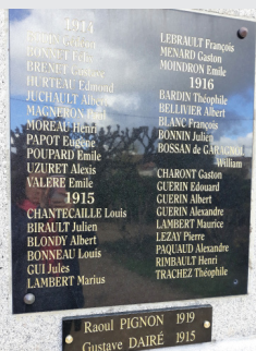
2 nouveaux noms ont été apposés sur le monument aux morts

Cette cérémonie a également été l'occasion pour Philippe Mathis et le Lieutenant-Colonel Hoarau de dévoiler une plaque sur le monument aux morts sur laquelle sont inscrits les noms de 2 poilus Créchois qui figuraient jusqu'alors seulement sur la plaque apposée dans l'église Notre-Dame-des-Neiges.