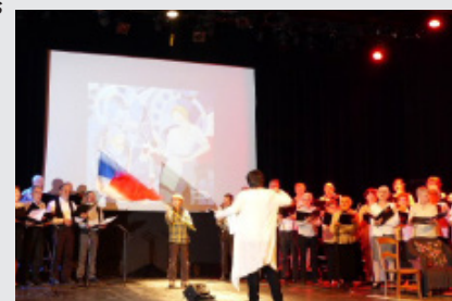
La chorale Crèche N'Do a fait salle comble