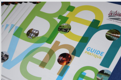
Le livret d'accueil des nouveaux habitants est disponible en Mairie ou sur le site de la Ville